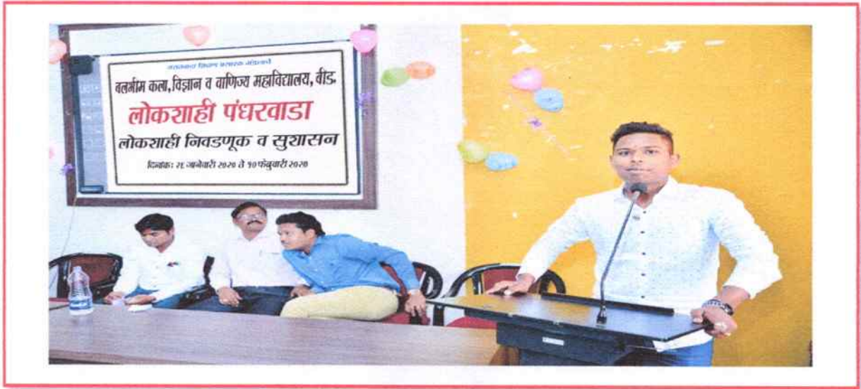
Student sharing his thought in elocution competition on democratic elections and governance on the occasion of Two weeks Campaign on Democracy held from 26/01/2020 to 10/02/2020