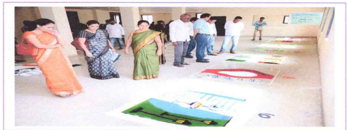
Glimpses of events and competition organised during the Two week programme on Democracy from 26/01/2018 to 10/02/2018.