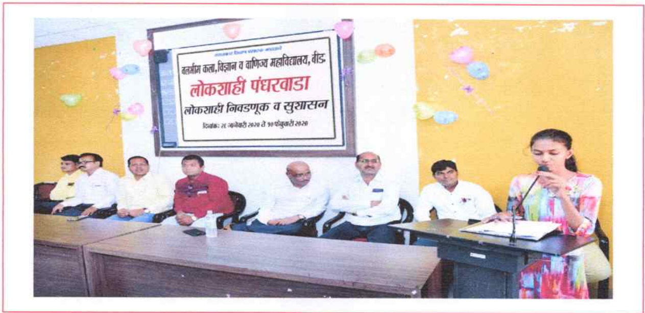
Student sharing his thought in debate competition on democratic elections and governance on the occasion of Two weeks Campaign on Democracy held from 26/01/2020 to 10/02/2020