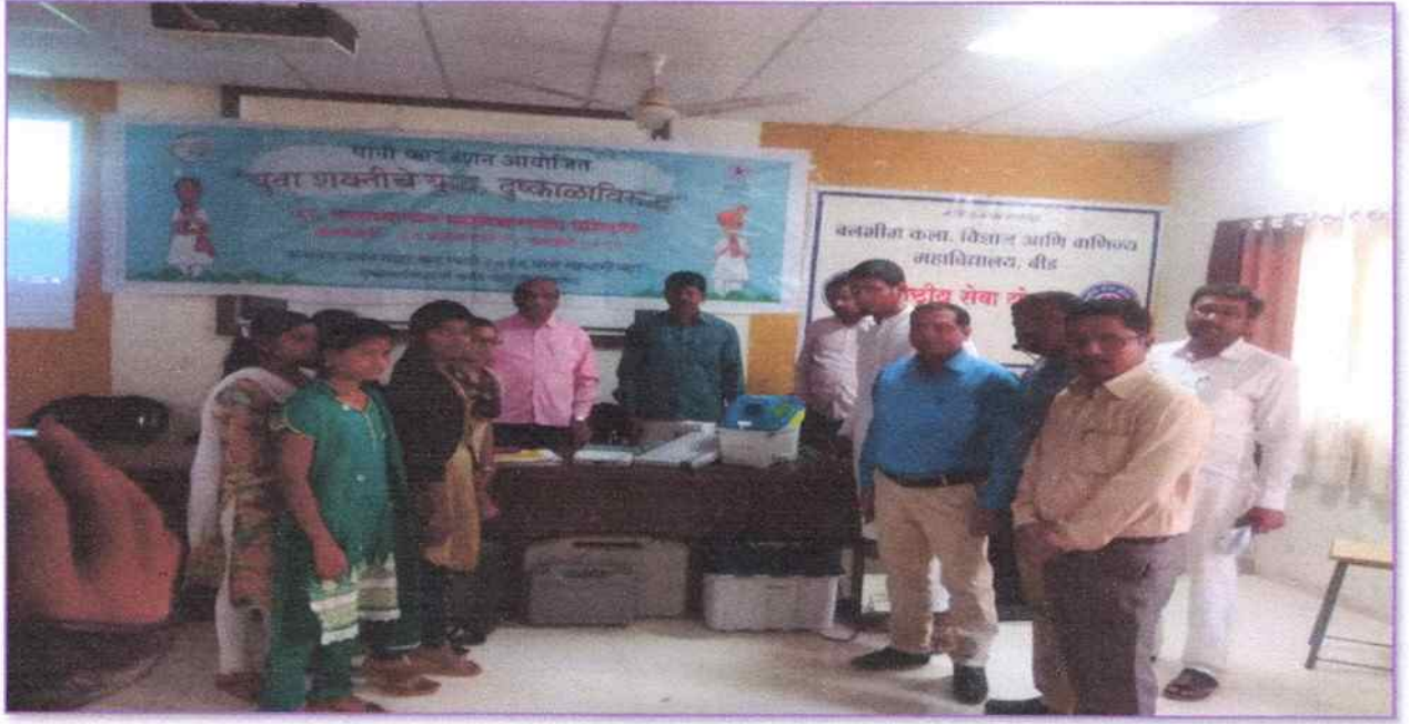
Glimpses of during the training provided by the trainer about how to operate and manage the E.V.M Machine and V.V.PAT held on 04/02/2019