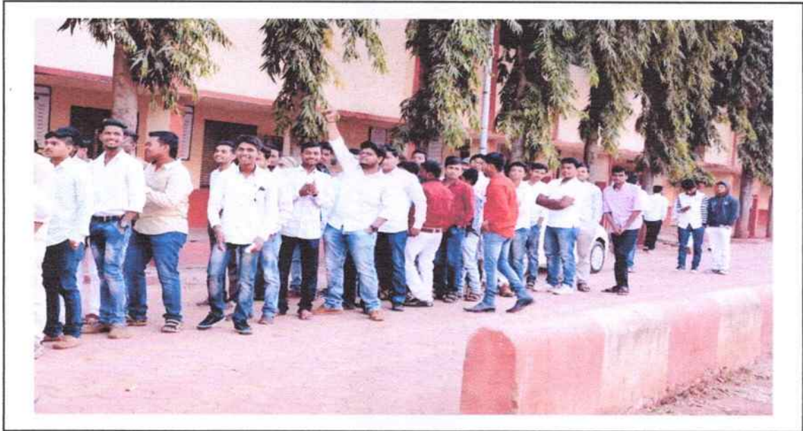
Photographs of rally organised during the occasion of two week campaign on Democracy held during 26/01/2019 to 10/02/2019